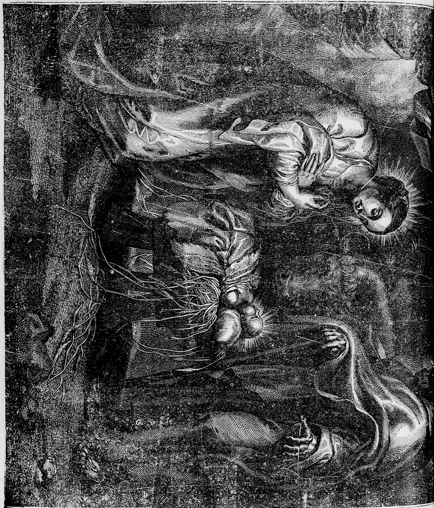
Kristus Pán sa narodil.