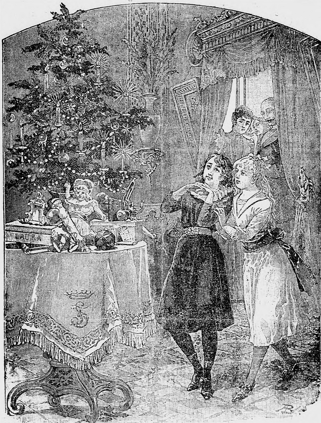
Radosť pobožných detí.

sem sa majú posielat predplatky, jako i dopisy do novin, ohlášky a náhodné reklamácie. Cena jedného 5 stĺpcového malého riadku je 10 kr. Rukopisy sa naspá k nedávajú.