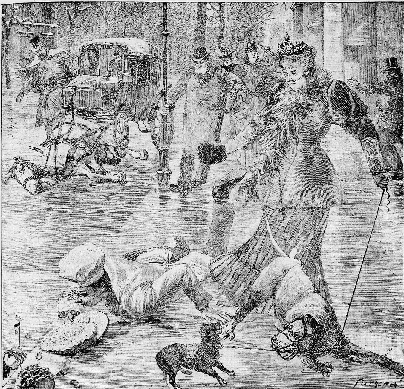
Obraz asfaltovej ulice v Budapešti, po rychlo nastatom mráze.

sem sa majú posilať predplatky, jako i do- pisy do novin, ohlášky a náhodné reklamácie. Cena jedného 5 stĺpcového malého riadku je 10 kr. Rukopisy sa naspák nedávajú.