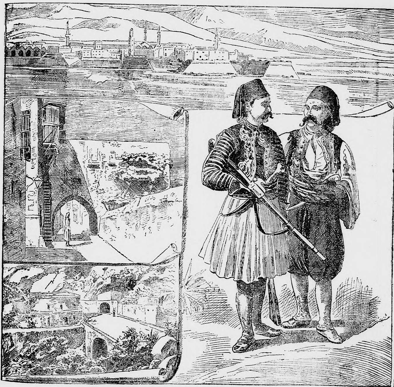
Turecký povstaleci na ostrove Kréte.

Redakcia a vydavateľstvo: V Budapešti VIII. ker., Práter-úlica 44. sem sa majú posielat predplatky, jako i do- pisy do novin, ohlášky a náhodné reklamácie. Cena jedneho 5 stĺpcového riadku je 10 kr. Rukopisy sa naspák nedávajú.