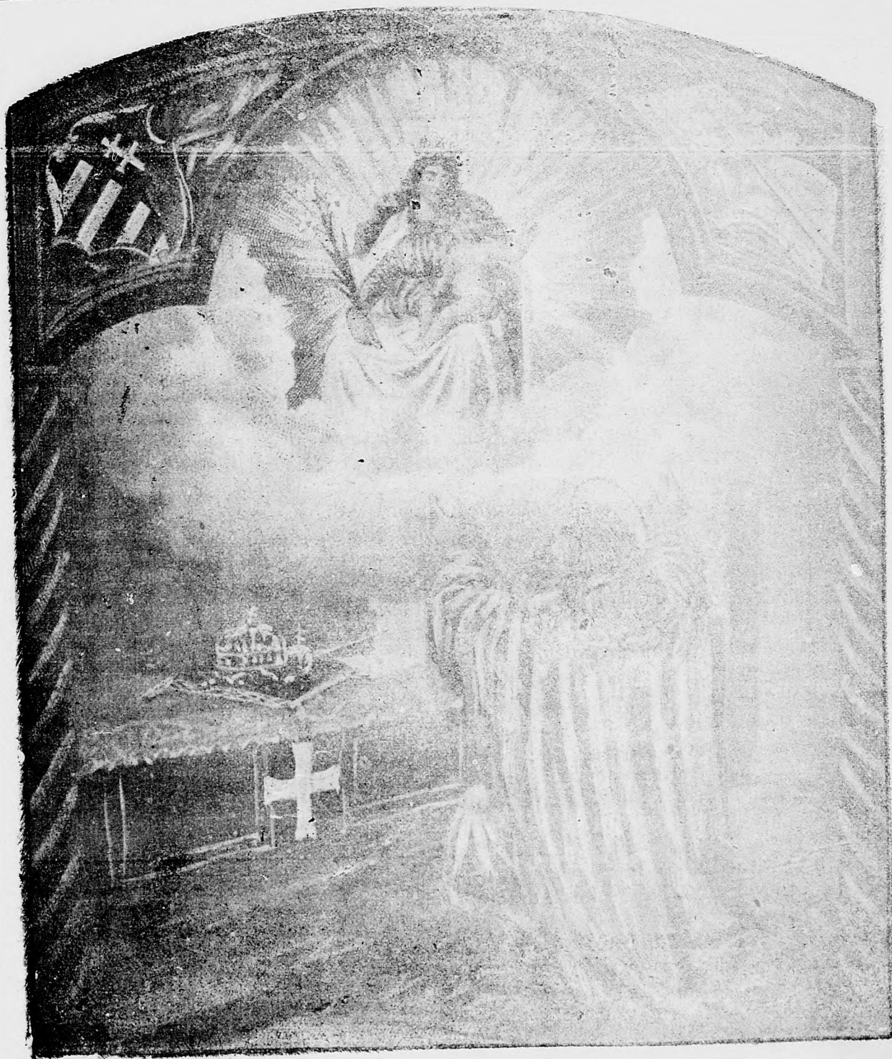
Sv. Štefan, prvý kráľ uhorský.

sem sa majú posilať predplatky, jako i do- pisy do novin, ohlášky a náhodné reklamácie. Cena jedneho 5 stĺpcového malého riadku je 10 kr. Rukopisy sa naspák nedávajú.