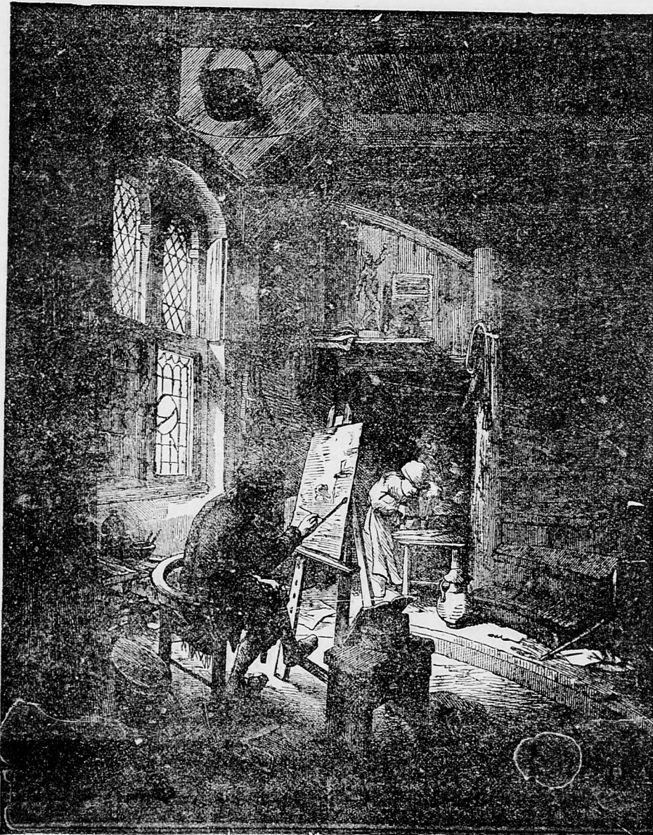
Na slávu Božiu.

sem sa majú posielat predplatky, jako i do- pisy do novin, ohlášky a náhodné reklamácie. Cena jedneho 5 stĺpcového malého riadku je 10 kr. Rukopisy sa naspák nedávajú.