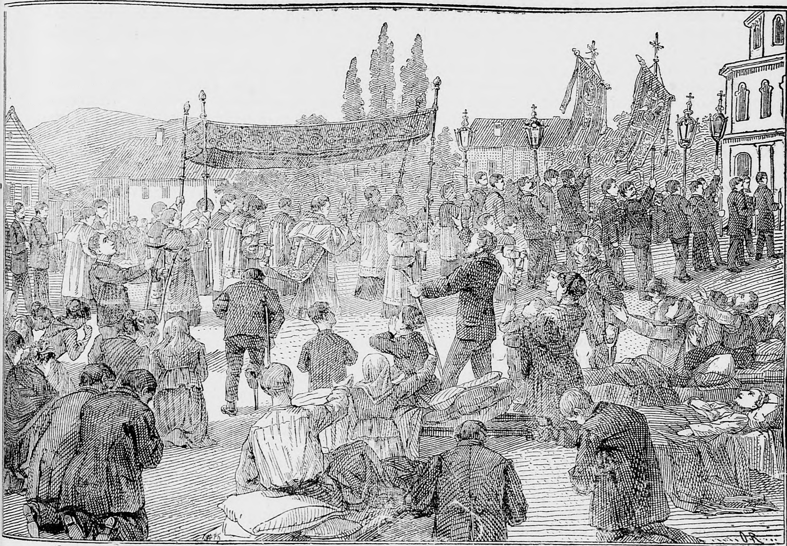
Pod tvoj plášť sa utikame, o Panno Maria!

sem sa majú posielat predplatky, jako i dopisy do novin, ohlášky a náhodné reklamácie. Cena jedneho 5 stĺpcového malého riadku je 10 kr. Rukopisy sa naspák nedávajú.