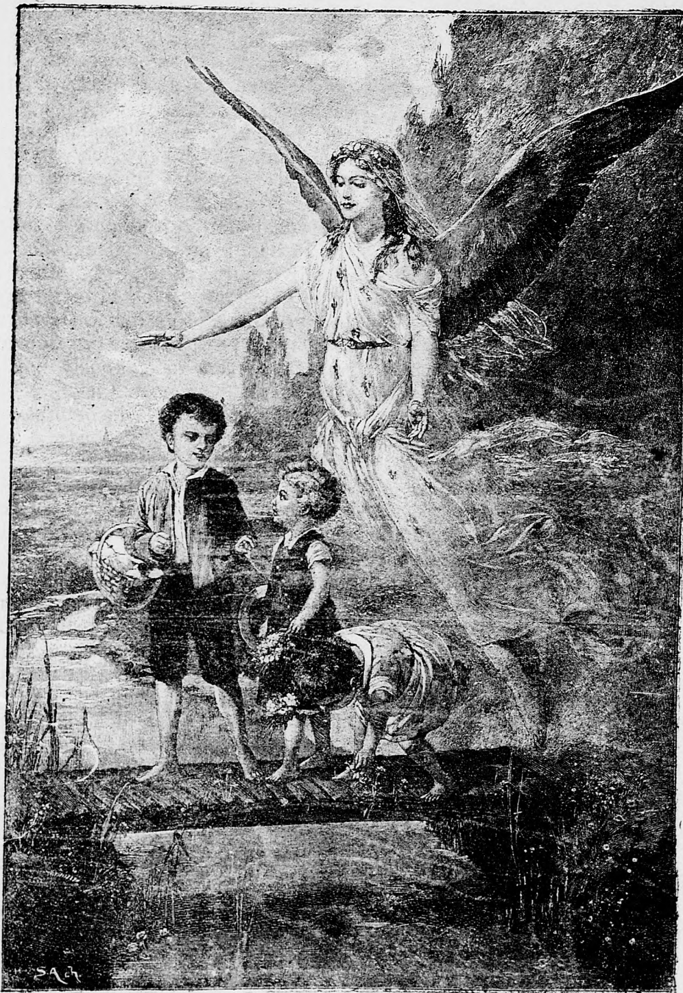
Malé deti pod ochranou anjela strážca.