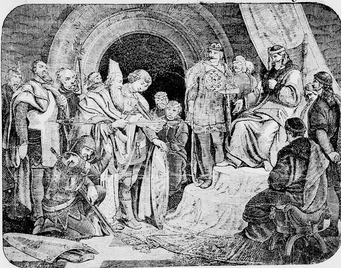
Sv. Ladislava kráľa uhorského volia za hlavného vodcu do križáckej války.

sem sa majú posielat' predplatky, jako i do- pisy do novin, ohlášky a náhodné reklamácie. Cena jedneho 5 stĺpcového malého riadku je 10 kr. Rukopisy sa naspák nedávajú.