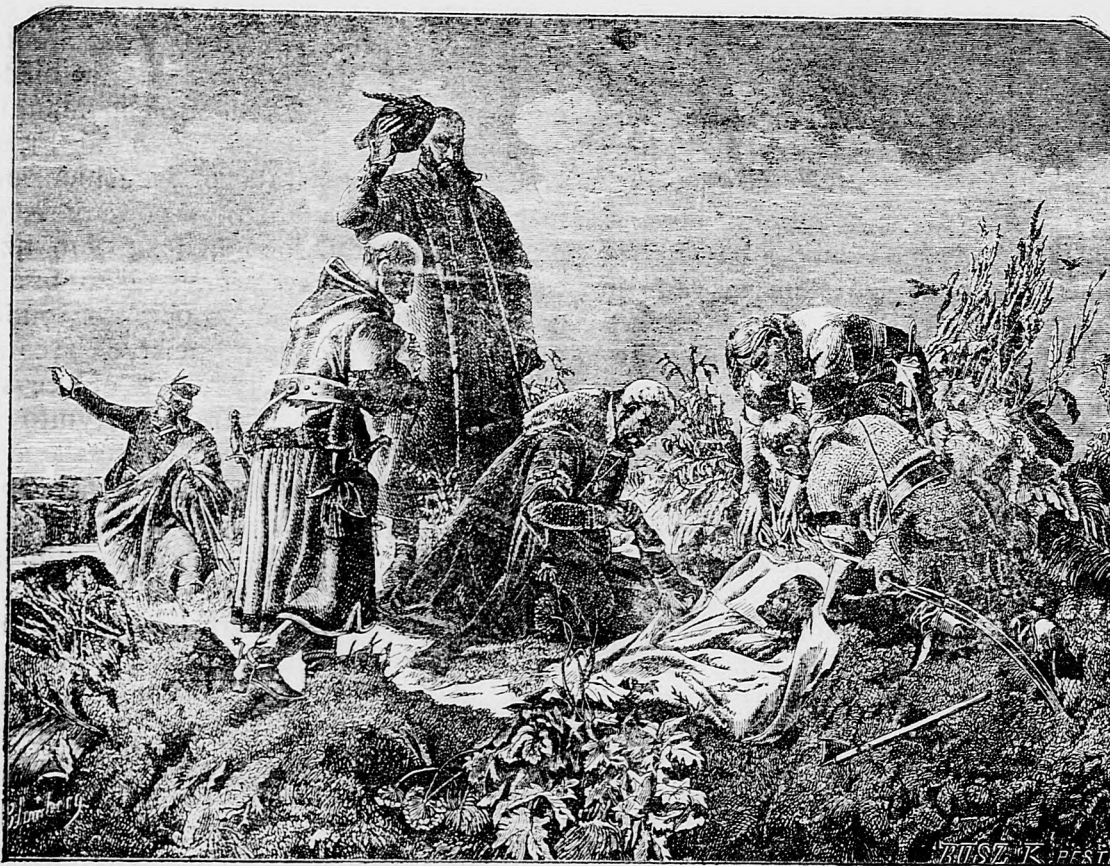
Našli mŕtvolu kráľa uhorského Ludvika druhého v potoku „Čele“ pri Moháče.

sem sa majú posielať predplatky, jako i dopisy do novin, ohlášky a náhodné reklamácie. Cena jedného 5 stĺpcového malého riadku je 10 kr. Rukopisy sa naspák nedávajú.