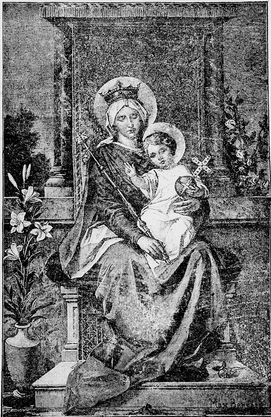
Patronka naša oroduj za nás.

sem sa majú posielat predplatky, jako i dopisy do novin, ohlášky a náhodné reklamácie. Cena jedneho 5 stĺpcového malého riadku je 10 kr. Rukopisy sa naspák nedávajú.