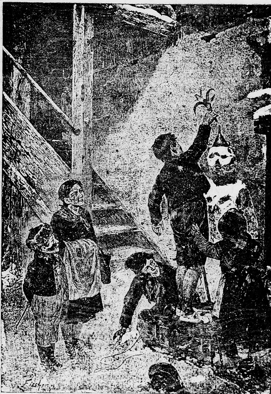
Ten sa dá ľahko trafiť!