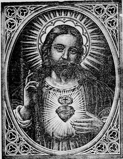
Svätá Trojica Sv. Jozef Maria pomôc Skríšenie Krista Pána Svätá Večera Maria Salome Sv. Jacques