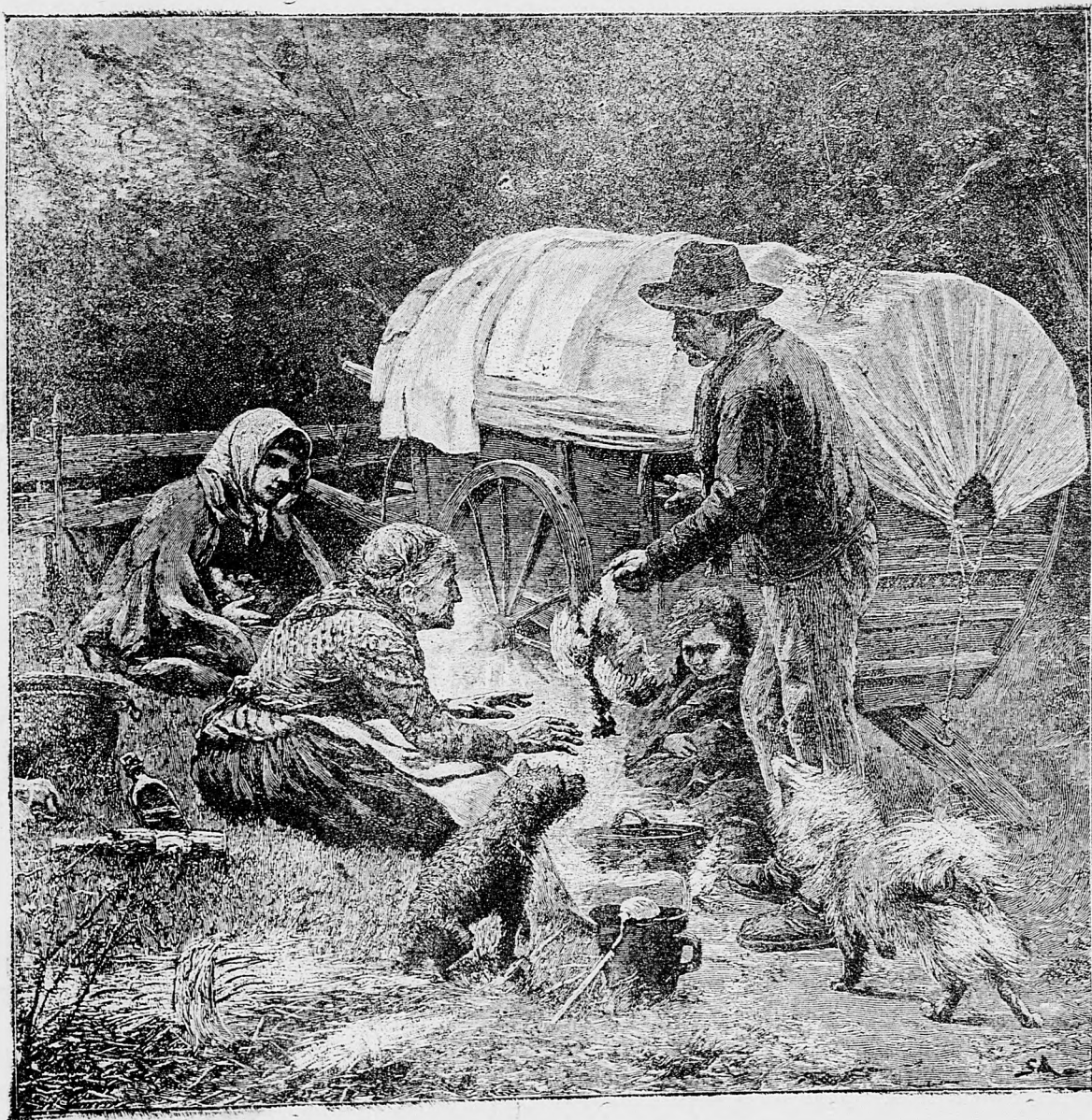
Večera v ceste.

sem sa majú posilať predplatky, jako i do- pisy do novin, ohlášky a náhodné reklamácie. Cena jedneho 5 stĺpcového malého riadku je 10 kr. Rukopisy sa naspák nedávajú.