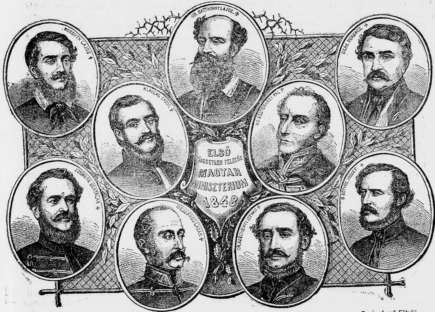
Bartolomej Szemere. Lazár Mészáros. Gr. Štefan Széchényi. Barón Jozef Eötvös.

Prvé neodvislé zodpovedné uhorské ministerstvo 1848.