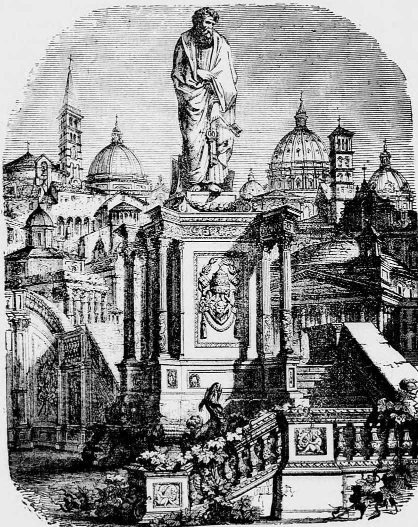
Socha sv. Petra v Ríme.

sem sa majú posielat predplatky, jako i dopisy do novin, ohlášky a náhodné reklamácie. Cena jedneho 5 stlpeového malého riadku je 10 kr. Rukopisy sa naspák nedávajú.