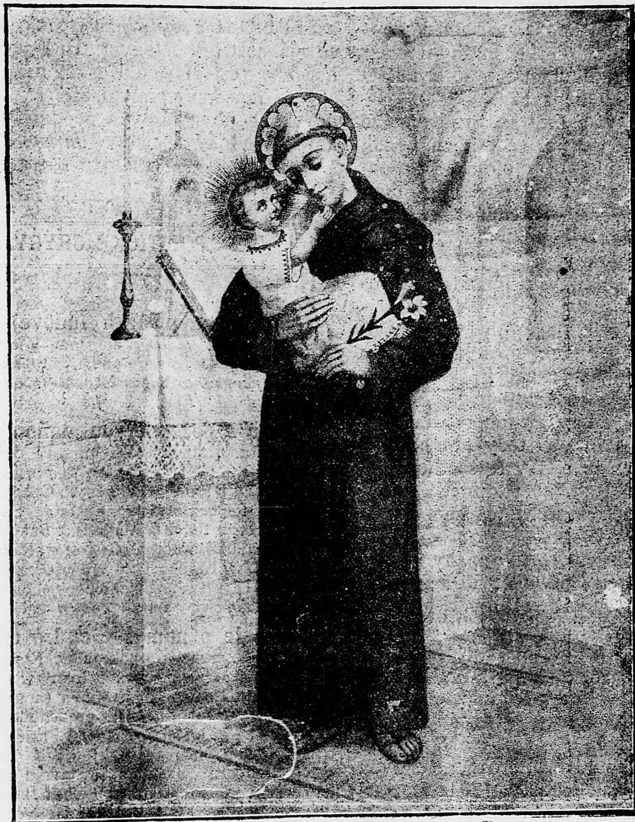
Sv. Anton z Paduy.

sem sa majú posielat predplatky, jako i de- pisy do novin, ohlášky a náhodné reklamácie. Cena jedneho 5 stĺpcového malého riadku je 10 kr. Rukopisy sa naspák nedávajú.