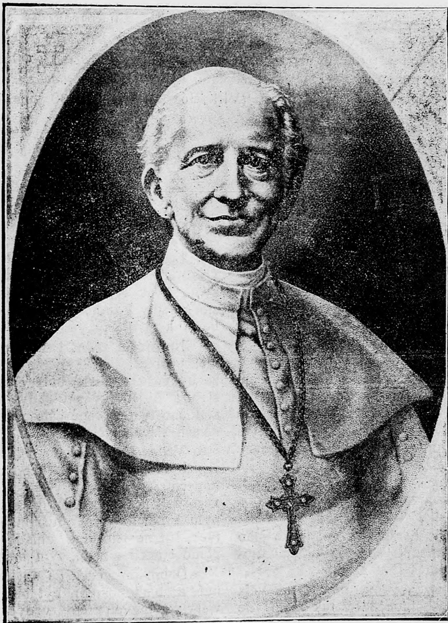
Terajší nástupca sv. Petra, pápež Lev XIII.

M. N. MUZEUM KÖNYVTÁRA Hírlap-könyvtár Névedéknapló 189 . év . 28.