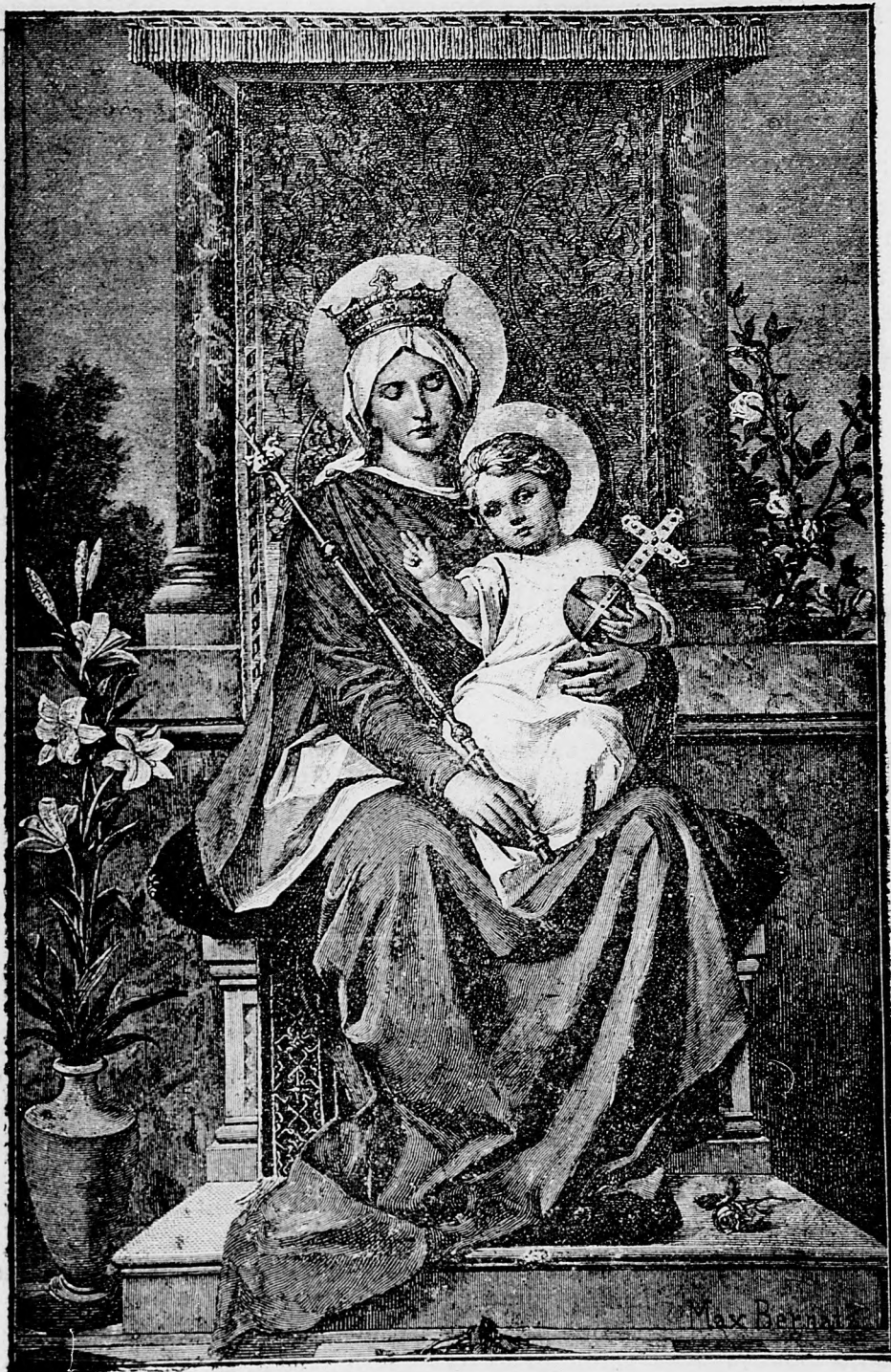
Matko predivná a Kráľovno anjelov, oroduj za nás!

M. N. MUZEUM KUNYI, JAR Hirtlap-Könyvtar Köveskapló 1898. 2335