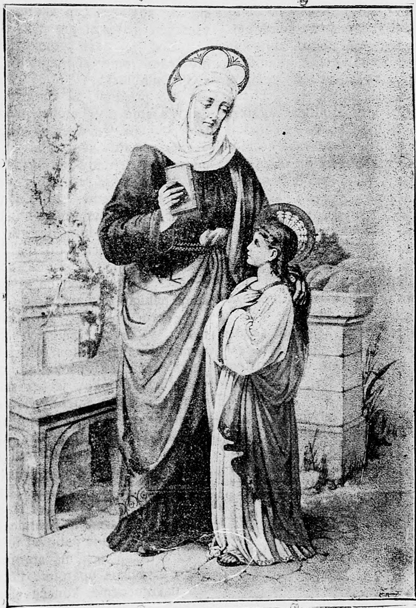
Sv. Anne, matka Bohorodičky, oroduj za nás!

sem sa majú posielat predplatky, jako i do- pisy do novin, ohlášky a náhodné reklamácie. Cena jedného 5 stĺpcového malého riadku je 10 kr. Rukopisy sa naspak nedávajú.