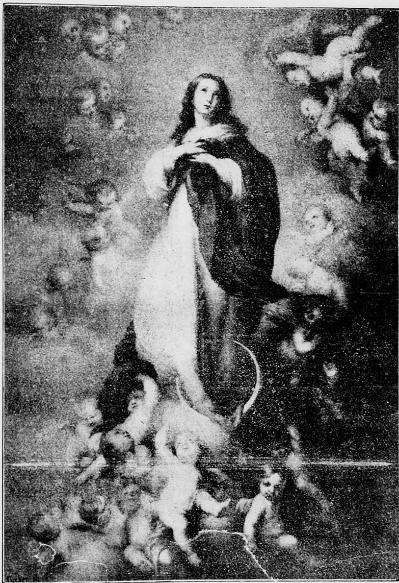
Nanebevzatie Panny Marie.

sem sa majú posielat predplatky, jako i do- pisy do novin, ohlášky a náhodné reklamácie. Cena jedného 5 stĺpcového malého riadku je 10 kr. Rukopisy sa naspák nedávajú.