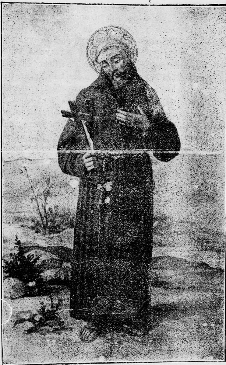
Assiský sv. Fraňo.

M. N. MUZEUM KÖNYVTÁRA Hírlap-Könyvtár Névedékszám 1899. 3/4