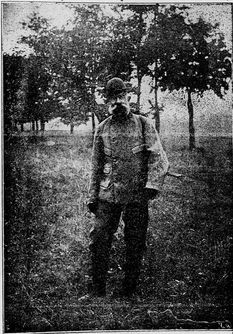
Jeho veličenstvo kráľ náš na poľovačke v Gödöllöve.

sem sa majú posielat predplatky, jako i do- pisy do novin, ohlášky a náhodné reklamácie. Cena jedneho 5 stĺpcového malého riadku je 10 kr. Rukopisy sa naspák nedávajú.