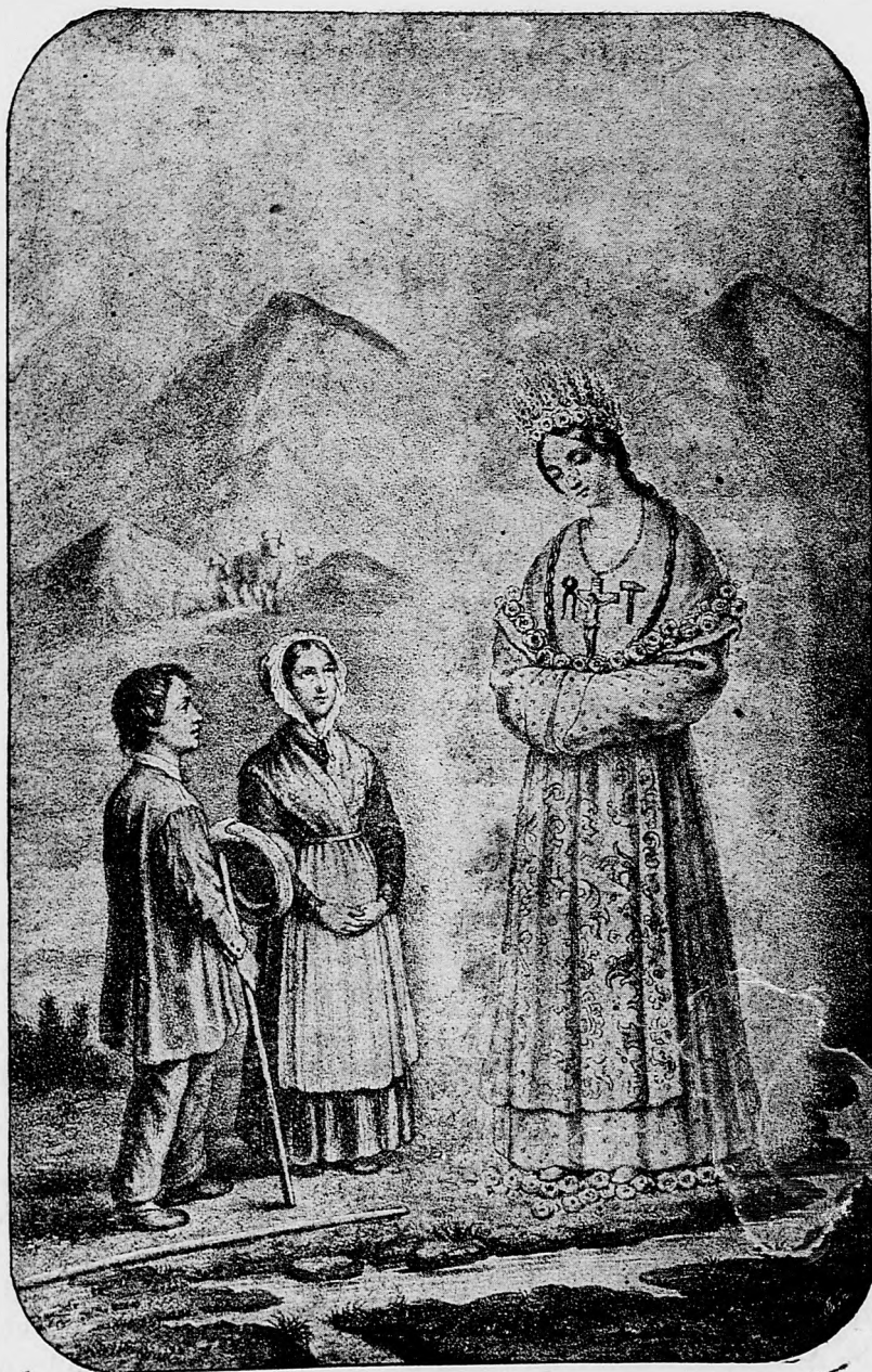
La saletteské zjavenie.

sem sa majú posielaf predplatky, jako i dopisy do novin, ohlášky a náhodné reklamácie. Cena jedného 5 stĺpcového malého riadku je 10 kr. Rukopisy sa naspák nedávajú.