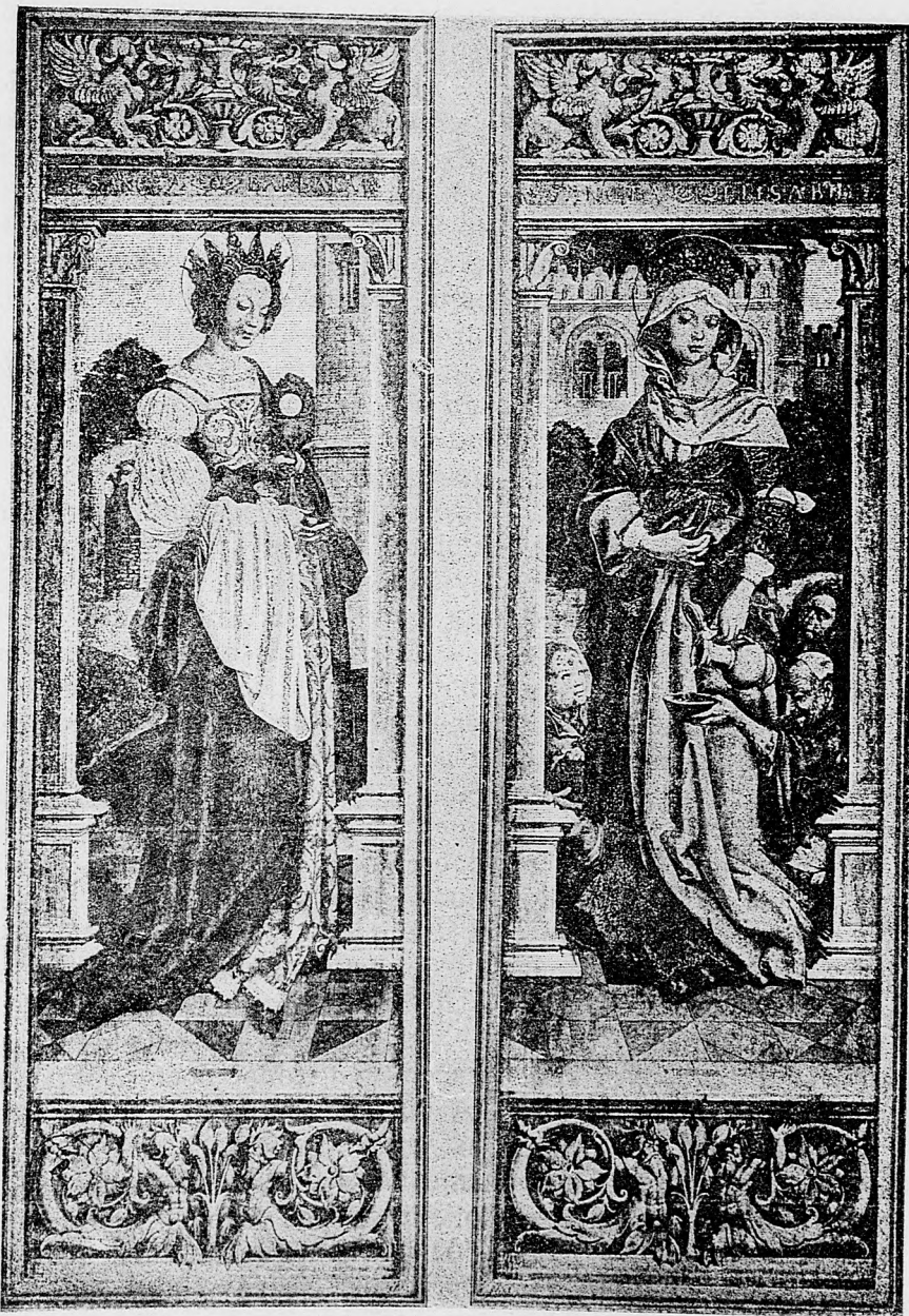
Sv. Barbora a Alžbeta.

Redakcia a vydavateľstvo : Budapest, VIII. ker., Józsefkörút 35. sem sa majú posielat predplatky, jako i do- pisy do novin, ohlášky a náhodné reklamácie. Cena jedného 5 stĺpcového malého riadku je 10 kr. Rukopisy sa naspák nedávajú.