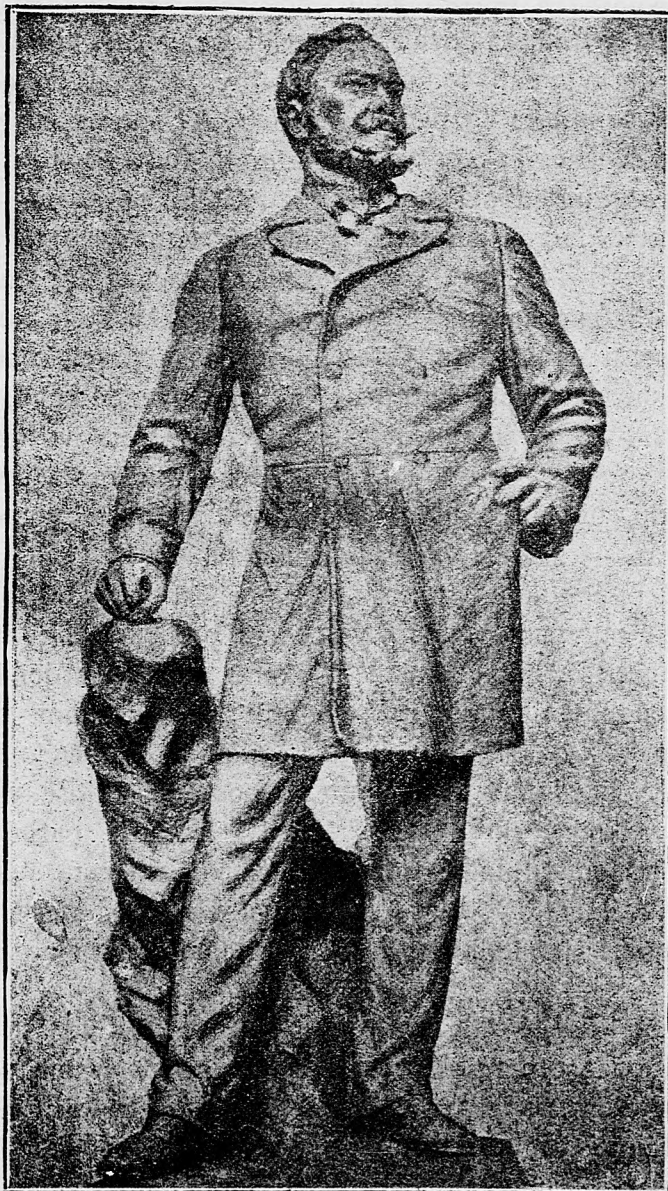
Socha Gabriela Barossa v Budapešti.

sem sa majú posielat predplatky, jako i dopisy do novin, ohlášky a náhodné reklamácie. Cena jedného 5 stĺpcového malého riadku je 10 kr. Rukopisy sa naspák nedávajú.