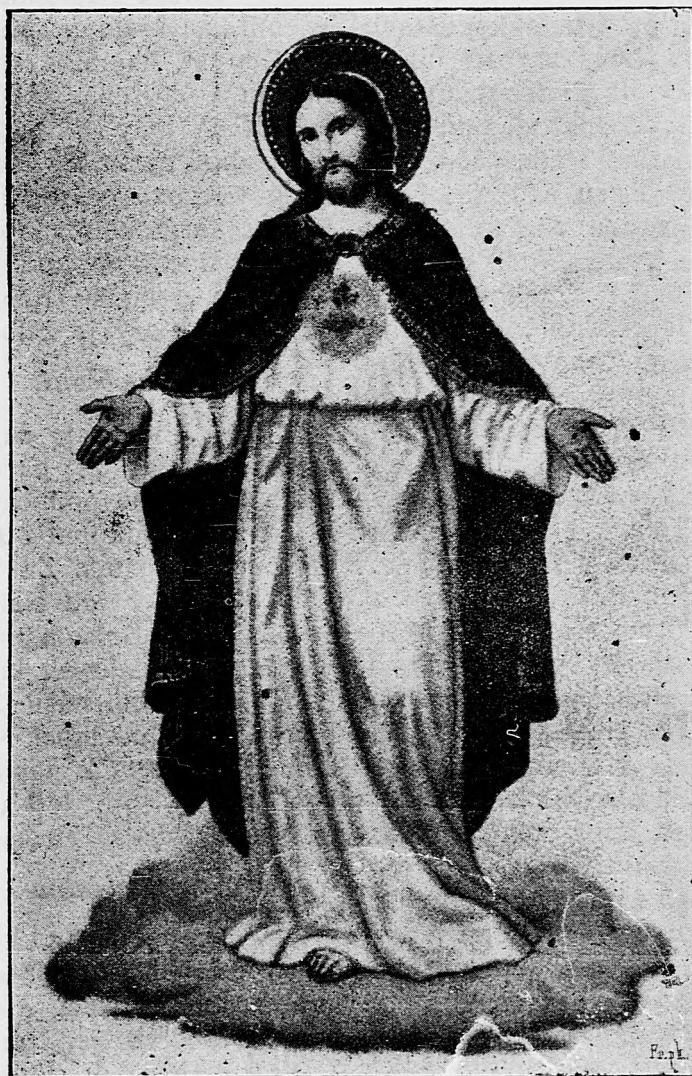
Najsladšie srdco Ježiša, smiluj sa nad nami!

sem sa majú posielat predplatky, jako i dopisy do novin, ohlášky a náhodné reklamácie. Cena jedného 5 stĺpcového malého riadku je 10 kr. Rukopisy sa naspák nedávajú.