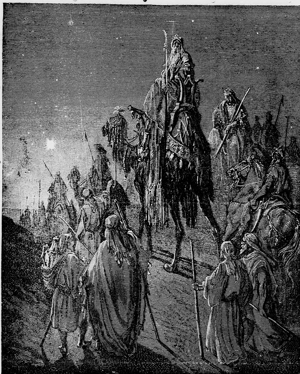
Traja králi od východu.

sem sa majú posielat predplatky, jako i dopisy do novin, ohlášky a náhodné reklamácie. Cena jedného 5 stĺpcového malého riadku je 10 kr. Rukopisy sa naspák nedávajú.