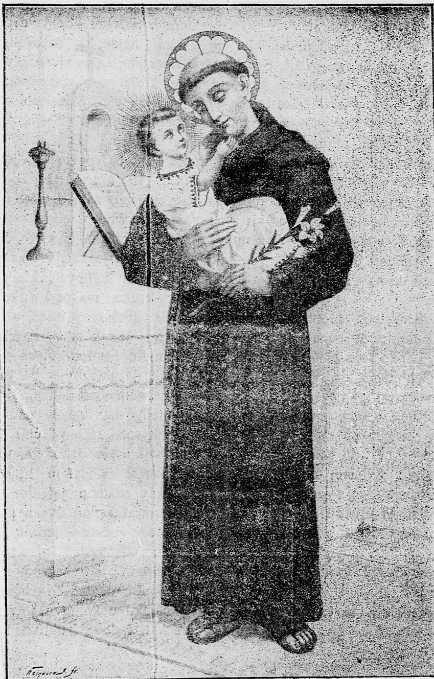
Sv. Anton Paduanský.

sem sa majú posielat predplatky, jako i do- pisy do novin, ohlášky a náhodné reklamácie. Cena jedného 5 slpcového malého riadku je 10 kr. Rukopisy sa naspák nedávajú.