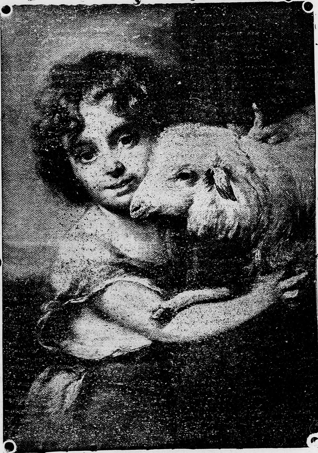
Svätý Ján s Beránkom.

sem sa majú posielat predplatky, jako i dopisy do novin, ohlášky a náhodné reklamácie. Cena jedneho 5 stĺpcoveho malého riadku je 10 kr. Rukopisy sa naspák nedávajú.