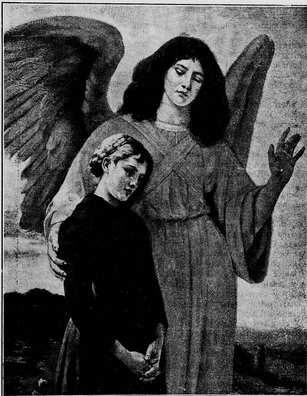
Anjel strážca čo chráni sroty.

sem sa majú posielaf predplatky, jako i dopisy do novin, ohlášky a náhodné reklamácie. Cena jedneho 5 stĺpcového malého riadku je 10 kr. Rukopisy sa naspák nedávajú.