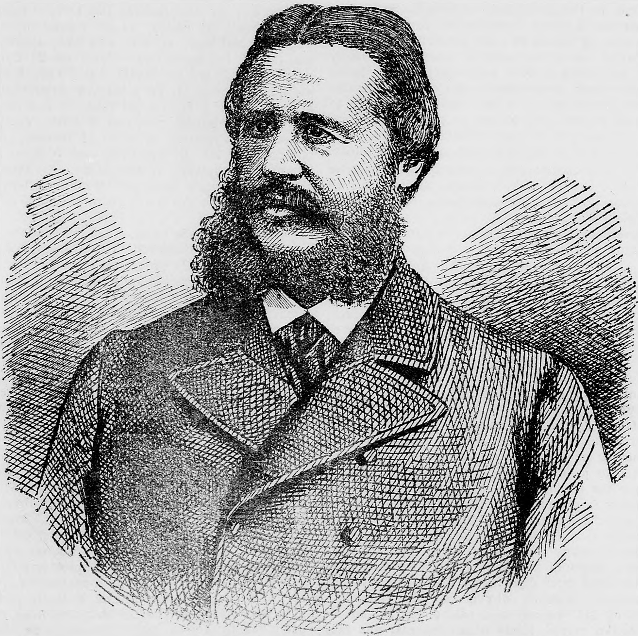
Koloman Széll, nový ministerpredseda.

sem sa majú posielat predplatky, jako i dopisy do novin, ohlášky a náhodné reklamácie. Cena jedneho 5 stĺpcového malého riadku je 10 kr. Rukopisy sa naspak nedávajú.