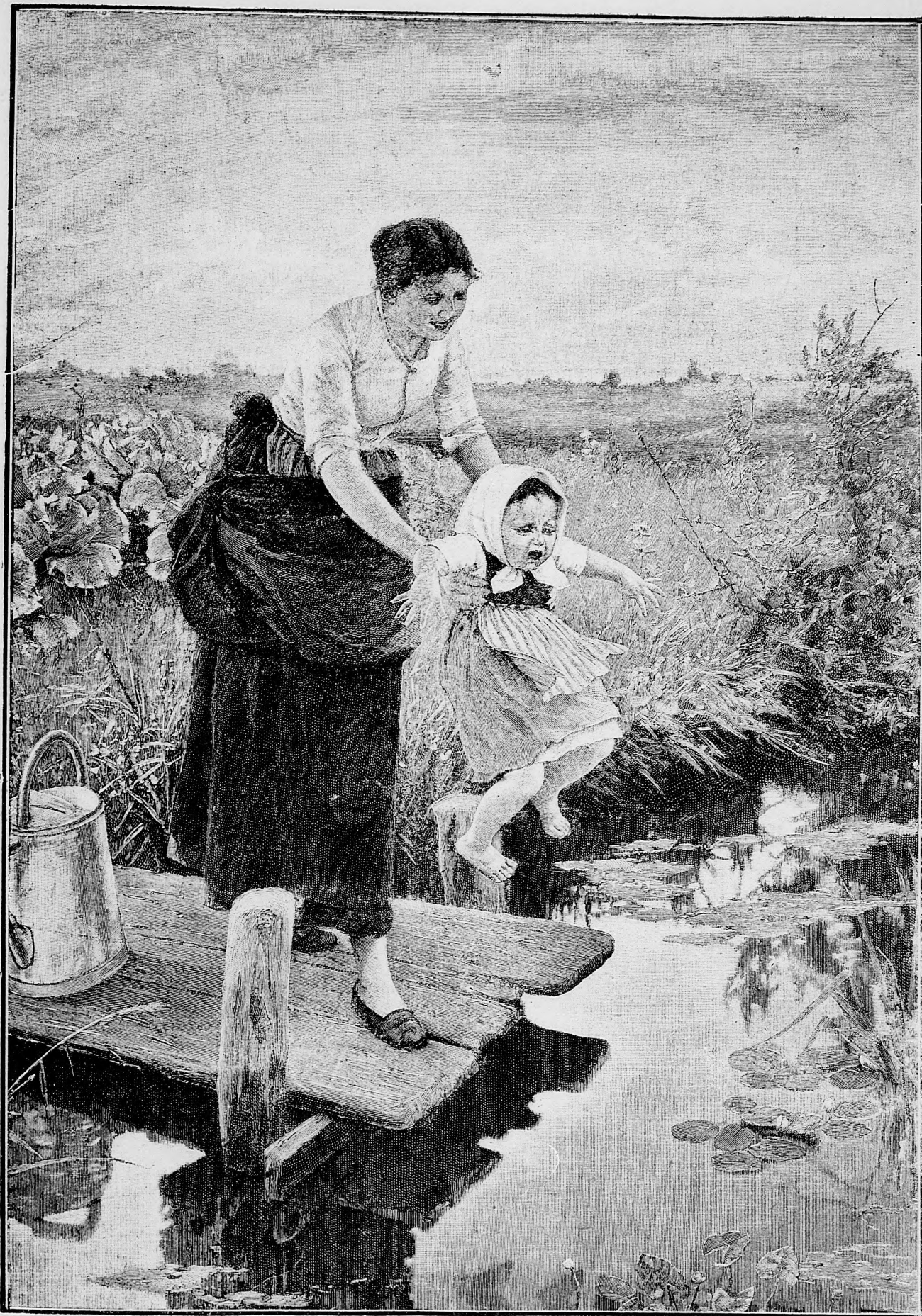
Však sa len veľmi bojí tej vody!