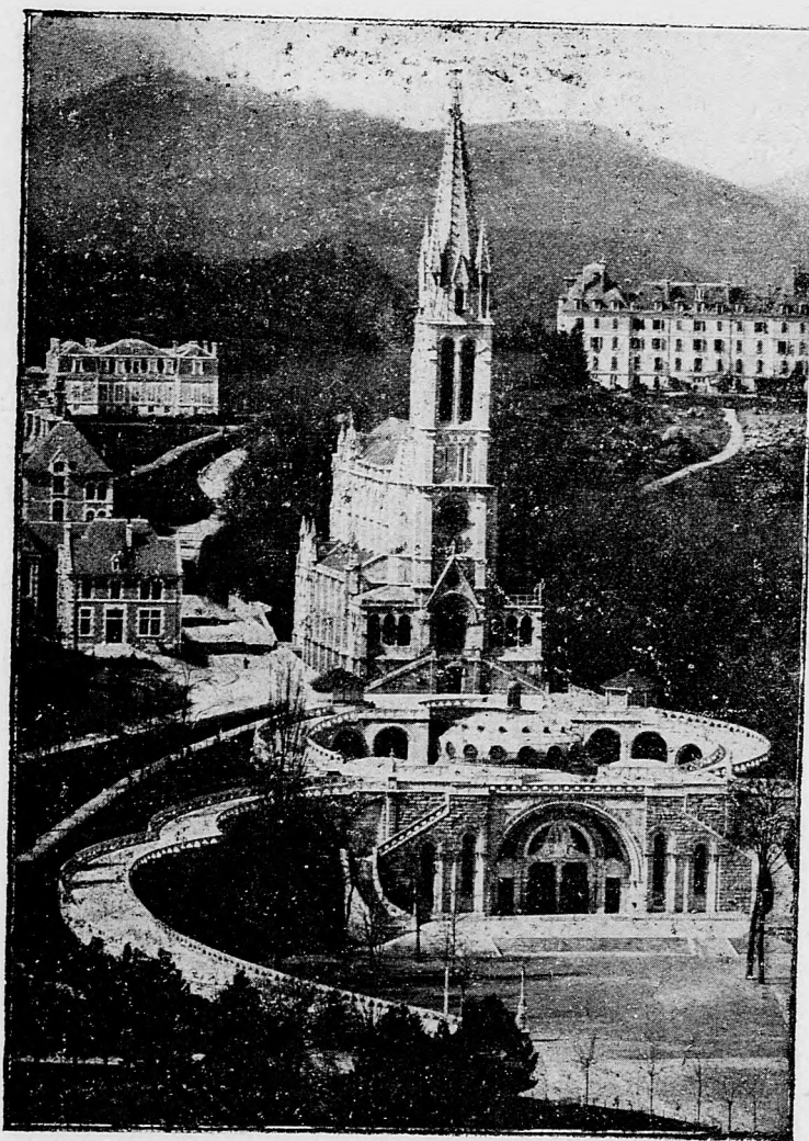
Hlavný kostol v Lurde,

sem sa majú posielat predplatky, jako i dopisy do novin, ohlášky a náhodné reklamácie. Cena jedného 5 stĺpcového malého riadku je 10 kr. Rukopisy sa naspak nedávajú.