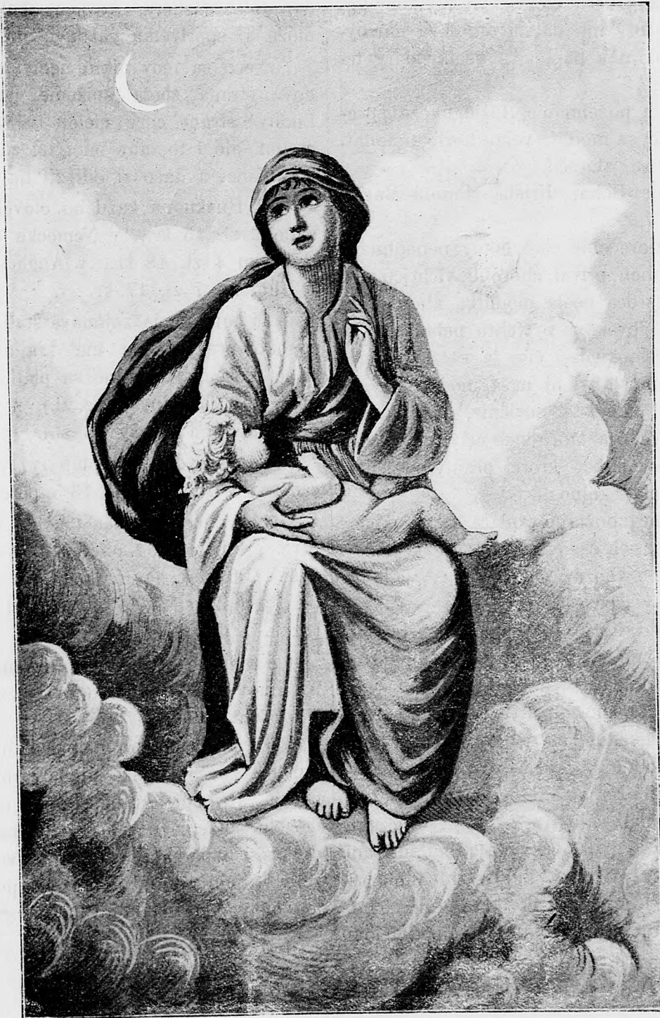
Sv. Matka Božia.

sem sa majú posielat predplatky, jako i dopisy do novin, ohlášky a náhodné reklamácie. Cena jedného 5 stĺpcového malého riadku je 10 kr. Rukopisy sa naspak nedávajú.