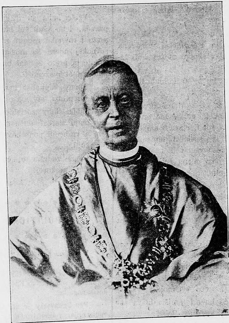
KONSTANTIN SCHUSZTER , vacovský biskup. 31. júla 1817. † 23. júla 1899.

sem sa majú posielat predplatky, jako i do- pisy do novin, ohlášky a náhodné reklamácie. Cena jedného 5 stĺpcového malého riadku je 10 kr. Rukopisy sa naspak nedávajú.