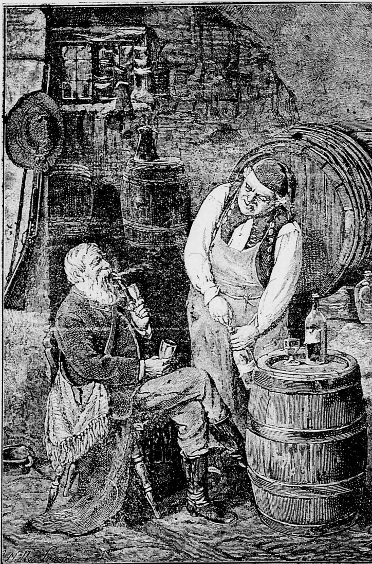
Ach bude to glg!

sem sa majú posielat predplatky, jako i dopisy do novin, ohlášky a náhodné reklamácie. Cena jedneho 5 stĺpcového malého riadku je 10 kr. Rukopisy sa naspak nedávajú.