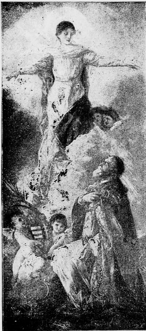
Sv. Štefan kráľ uhorský obetuje Uhorsko Bohorodičke.

sem sa majú posielat predplatky, jako i do- pisy do novin, ohlášky a náhodné reklamácie. Cena jedného 5 stĺpcového malého riadku je 10 kr. Rukopisy sa naspak nedávajú.