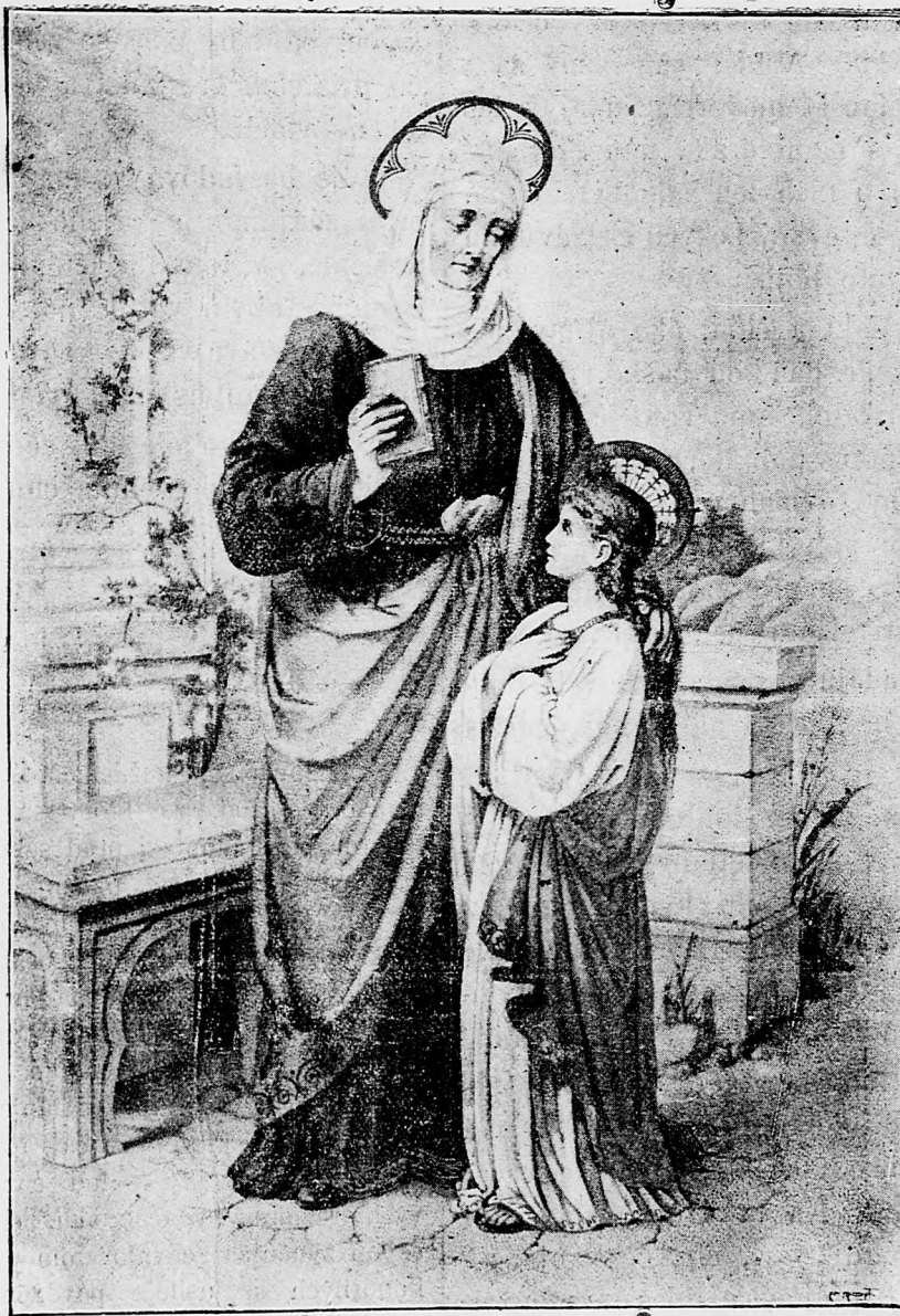
Sv. Anna, oroduj za nás!

sem sa majú posielat predplatky, jako i do- pisy do novín, ohlášky a nahodné reklamácie. Cena jedneho 5 stĺpcového malého riadku je 10 kr. Rukopisy sa naspak nedávajú.