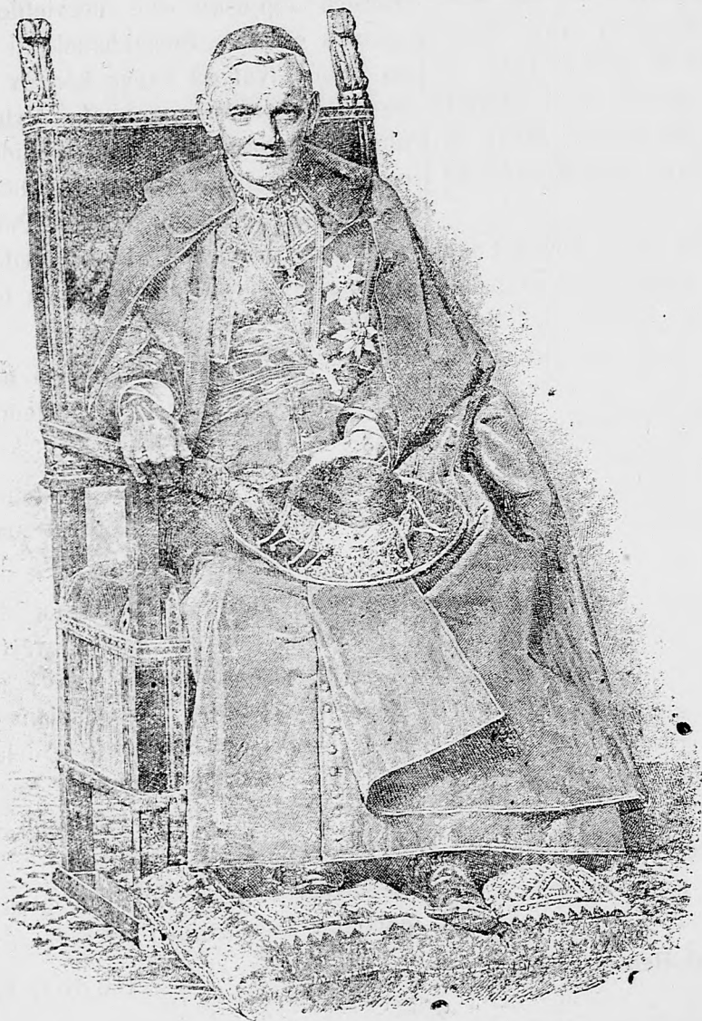
Kl. Vaszary, kardinál primás.

sem sa majú posielat predplatky, jako i do- pisy do novin, ohlášky a náhodné reklamácie. Cena jedneho 5 stĺpcového malého riadku je 10 kr. Rukopisy sa naspak nedávajú.