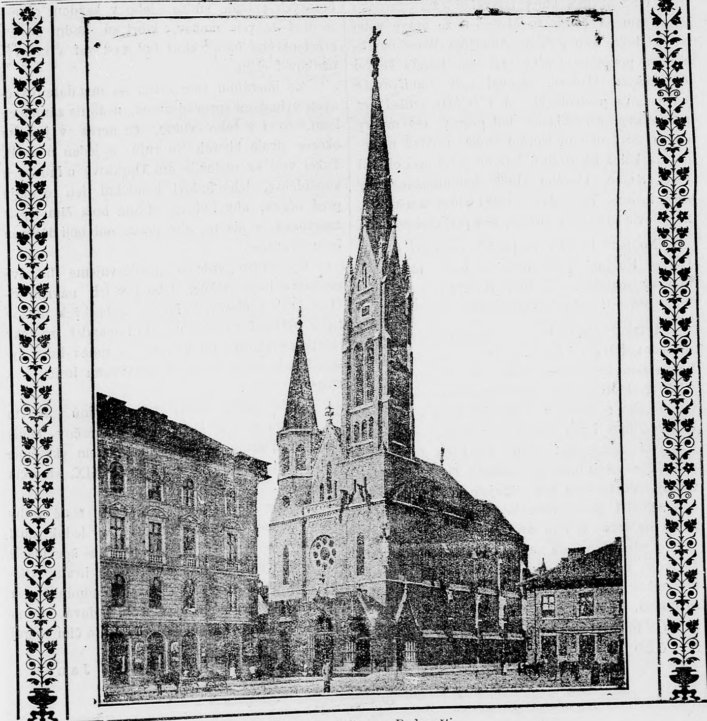
Kostol karmelitov v Budapešti.

Redakcia a vydavateľstvo: Budapešť, VIII. ker., Józsefkörút 35. Sem sa majú posielat predplatky, jako i do- pisy do novin, ohlášky a náhodné reklamácie. Cena jedného 5 stĺpcového malého riadku je 10 kr. Rukopisy sa naspak nedávajú.