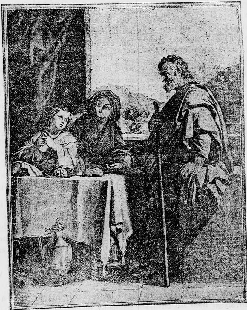
Malý Ježiš vysvetľuje sväté Písmo svojim rodičom.

sem sa majú posielat predplatky, jako i dopisy do novin, ohlášky a náhodné reklamácie. Cena jedného 5 stĺpcového malého riadku je 10 kr. Rukopisy sa naspak nedávajú.