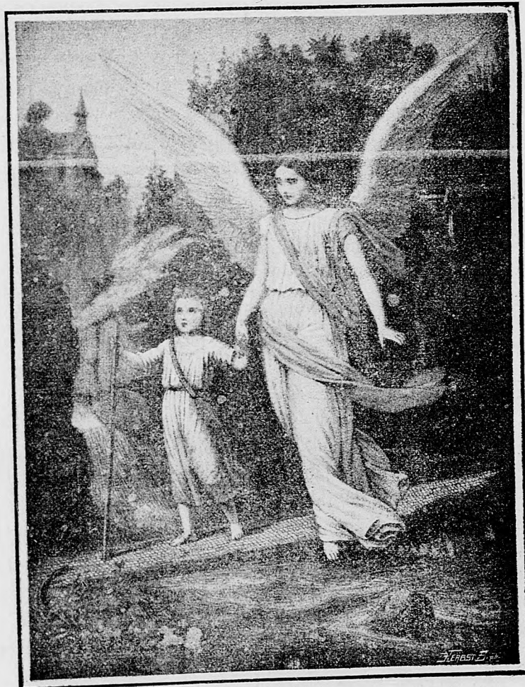
Anjel strážca detí.

sem sa majú posielat predplatky, jako i do- pisy do novin, ohlášky a náhodné reklamácie. Cena jedneho 5 stĺpcového malého riadku je 10 kr. Rukopisy sa naspak nedávajú.