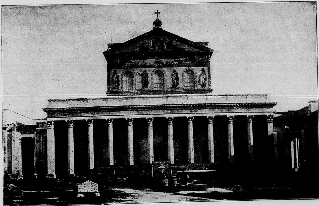
Chrám sv. Pavla v Ríme.