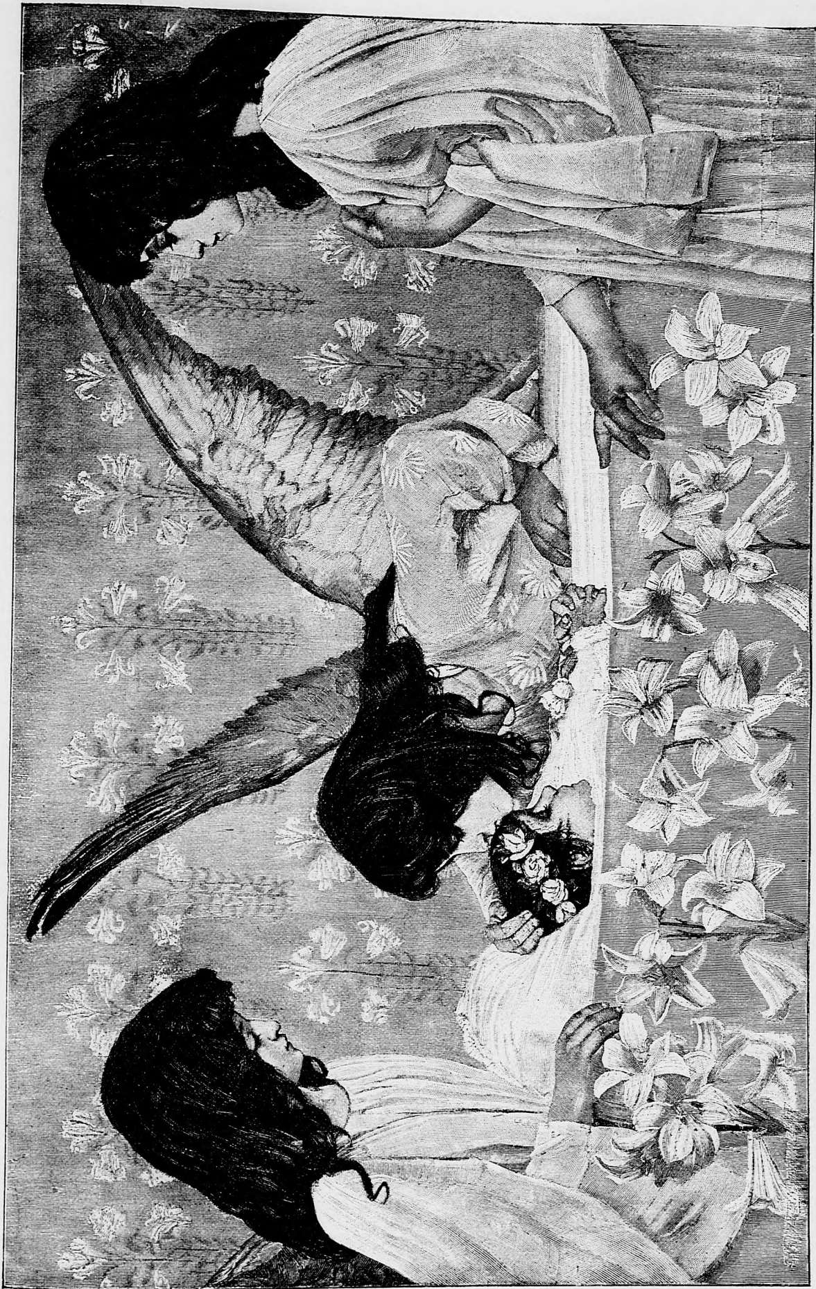
Pri rakve nevinného dieťaťa.