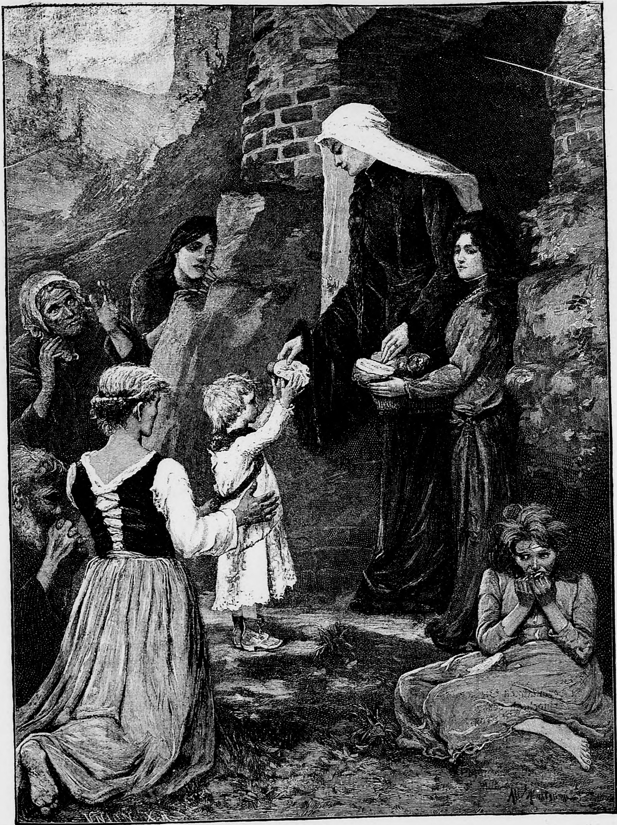
Sv. Alžbeta uhorská, vzor krestanskej dobročinnosti.