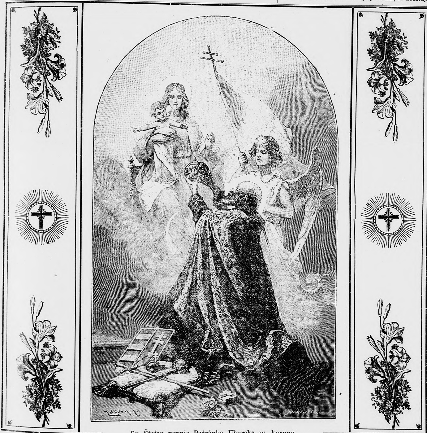
Sv. Štefan venuje Patrónke Uhorska sv. korunu.

sem sa majú posielat' predplatky, jako dopisy do novin ohlásoky a náhodné reklamácie. Cena jedného 5 stĺpcového malého riadku je 20 hl. Rukopisy sa naspak nedávajú.