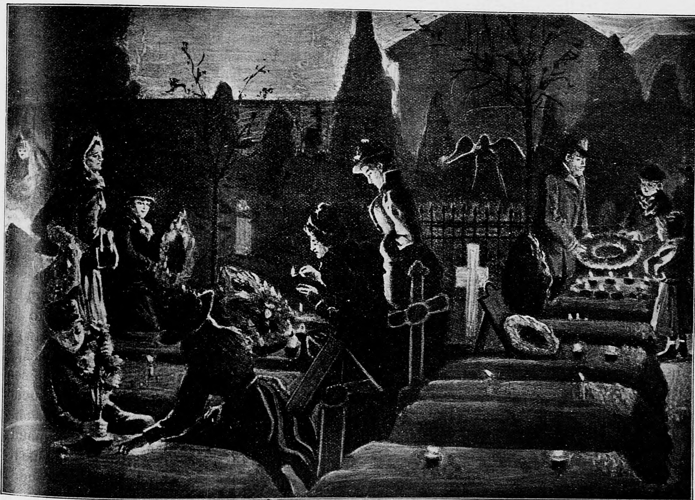
Podvečier verných dušičiek na cimiteri.

zo svojich remesiel a čo by sa aj potrhali. A vysvitá z jeho dôvodov i to, že nielen tisíce poriadnych pracovných síl ostávajú bez chleba, lež i to, že sama krajina pri tom ohromné škody utrpí. Nuž a výsledok takeho liberálneho zákonodárstva? Je strašný! S jednej strany samý žid-boháč, samý millionár — s druhej strany obrovské dlhy krajinské a sozobráčená až na zaplakanie trieda remeselnicka.