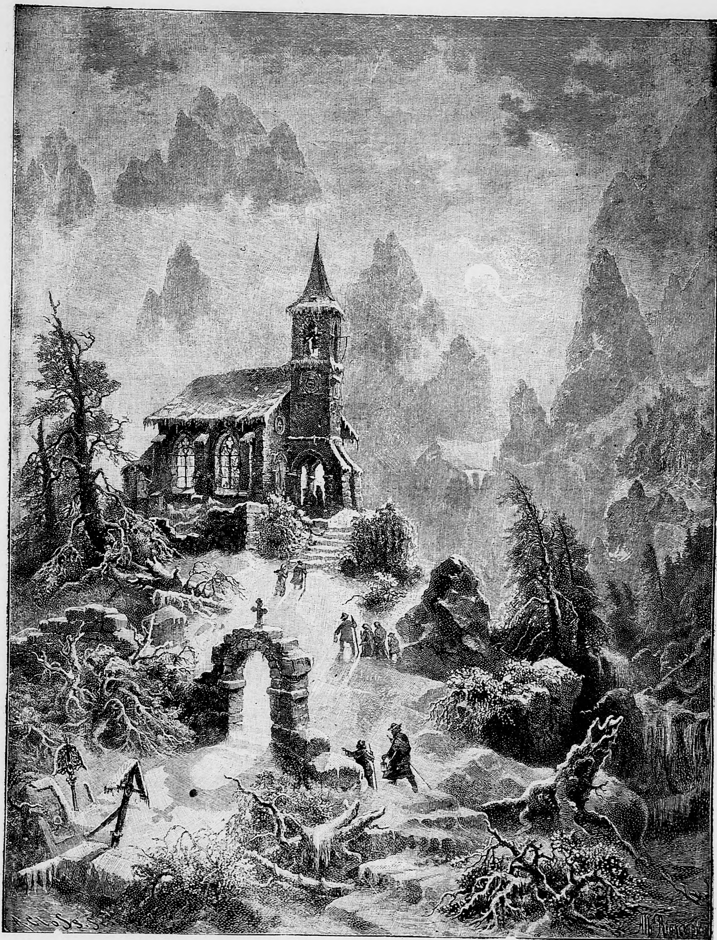
Pospech na polnočnú sv. omšu vianočnú.