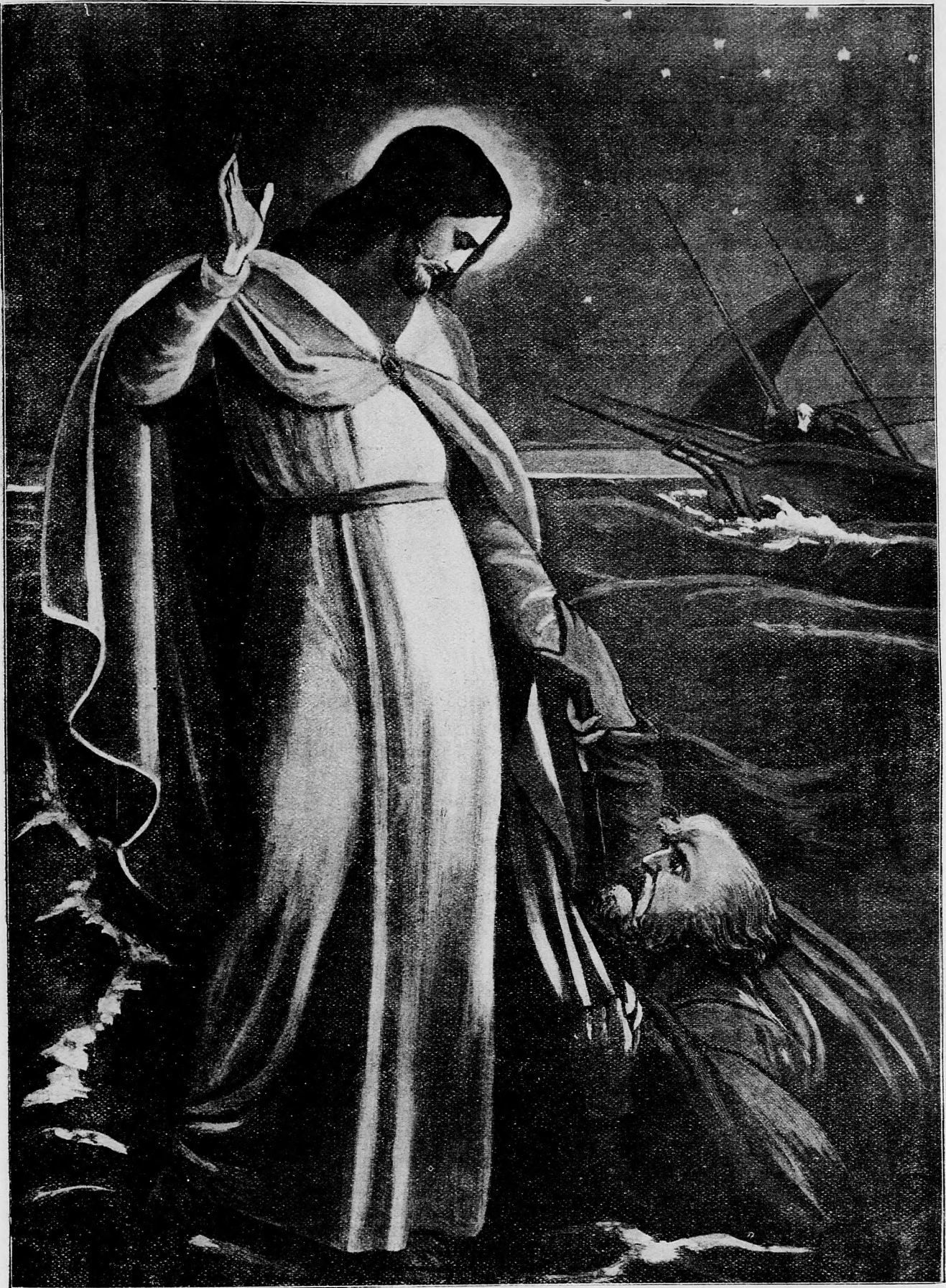
Malomyselný, prečo pochybuješ?