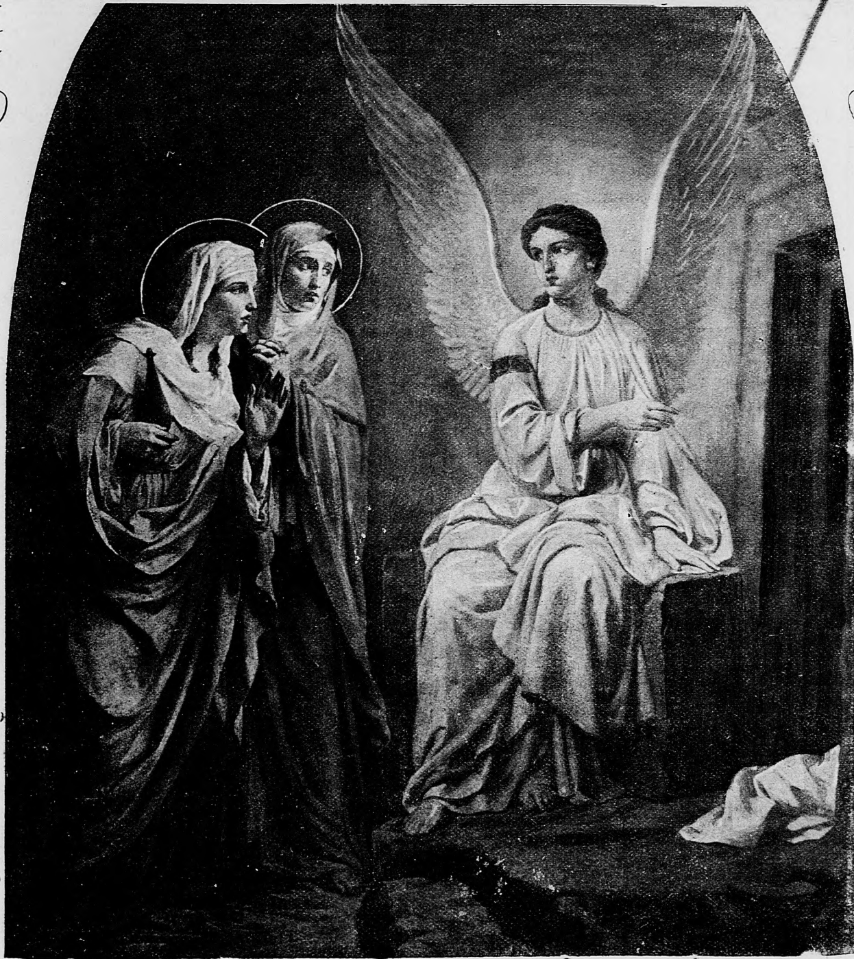
Pán Ježis vstal z mrtvých.

sem sa majú posielat' predplatky, jako dopisy do novin, ohlášky a náhodné reklamácie. Cena jedného 5 slupcového malého riadku je 20 hl. Rukopisy sa naspäť nedávajú.